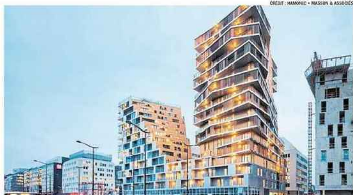
CRÉDIT : HAMONIC + MASSON & ASSOCIÉS

Le concours Imagine Angers tient ses promesses. De grands architectes figurent parmi les finalistes.